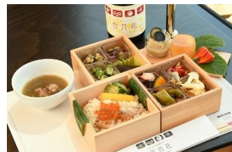
※画像は昨年のものです。

(3) お食事：魚沼市の大人気宿泊施設「里山十帖」調製の特製三段重 初夏の新潟の海の幸・山の幸にこだわったお食事です。