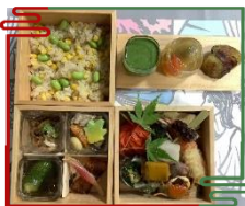
■画像はイメージです。

さらに、同店の女将より、お食事にあわせて 選定いただいた 新潟県産の日本酒 数種類を、 今回の特別便限定!【飲み放題】でご提供いたします。