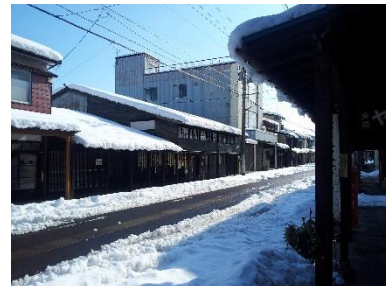
雁木町家「旧今井染物屋」