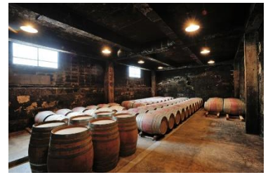
※お食事やワインの画像はイメージです。