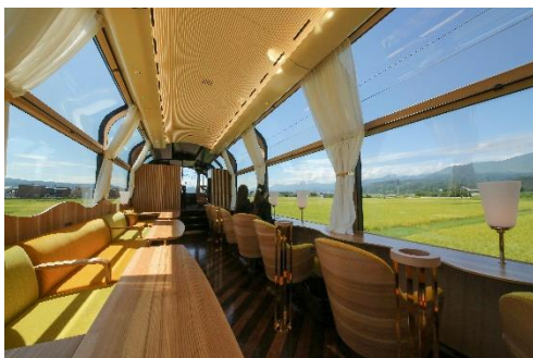
非日常を開放的な雪月花の車内で

えちごトキめき鉄道妙高はねうまライン、しなの鉄道北しなの線、JR東日本信越本線を経由し、しなの鉄道線上田駅まで、旧北国街道を辿る、ロマンあふれる旅を御用意。