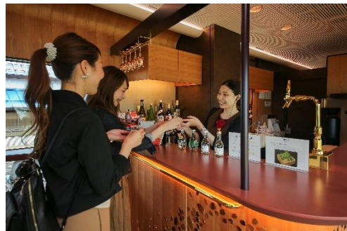
さくらラウンジで厳選されたお飲み物を