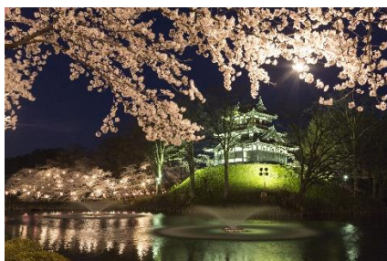
日本三大夜桜「高田城三重櫓」