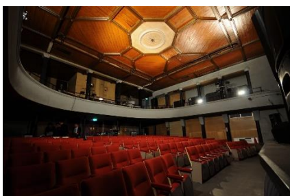
百年映画館「高田世界館」