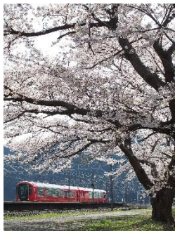
沿線の桜がおもてなし