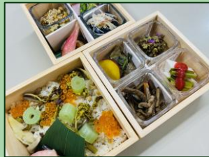
※画像はイメージです。本便で提供する食事とは異なります。

明治創業の老舗日本料理店「松風園藤作」(直江津)の、旬の食材を贅沢に使った和食三段重とデザートを雪月花車内でご提供します。